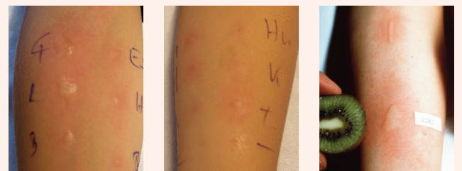
Bild 3 zeigt das Resultat einer Prick-to-Prick-Testung: dabei wurde das Allergen, z.B. Kiwi, mit der Pricktestnadel angestochen und direkt in die Haut geprickt.